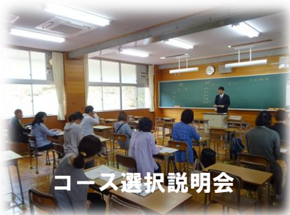
コース選択説明会